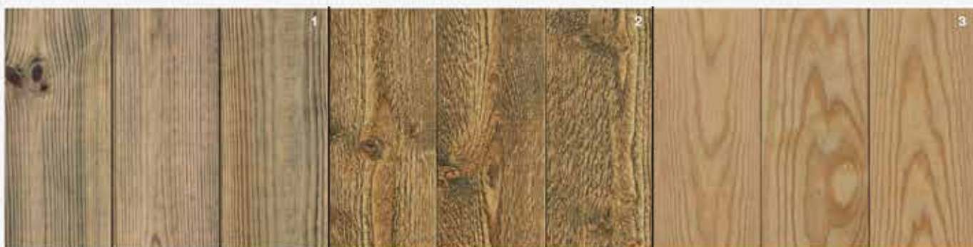
Farbproben: 1. Druckimprägniertes Holz. 2. Ungesägte Kiefernholzpaneele. 3. Gehobelte Kiefernholzpaneele.

Abhängig vom Alter des Holzes verleiht das unpigmentierte Teeröl einen goldenen oder leicht grauen Farbton, der mit der Zeit verblasst. Nach der Einwirkung von UV-Strahlung und Witterungseinflüssen kehrt das Holz zu seinem natürlichen Farbton zurück. Perfekt für alle, die den ursprünglichen Ausdruck beibehalten möchten und gleichzeitig alle schützenden Eigenschaften des Teeröls erhalten wollen.